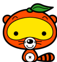
おげんきのんたくん