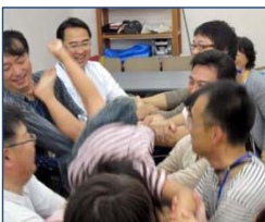
パパならではの ダイナミックな鯉の滝のぼり