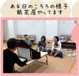
ある日のころろの様子 紙芝居やっています

NPO法人子どもコミュニティネットひろしま 〒730-0051 広島市中区大手町 3-7-3 広島トミタビル1F Tel 082-243-1151 Fax 082-243-1152 E-mail info@kodomo-net.jp http://www.kodomo-net.jp