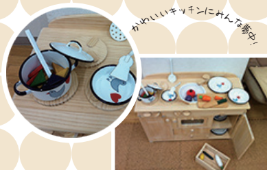
かわいいキッチンにみんなで遊び!