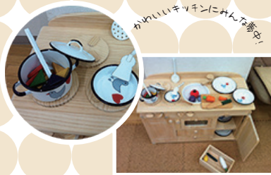
かわいいキッチンにみんな遊ぶ!