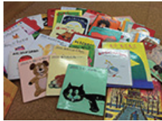
絵本がたてさん♪紙芝居もあつ!

広いお部屋でゆったり過ごしながら、 仲間づくりに情報交換・・・ お気に入りのおやつやランチを持って来たり 買い出しにでるのもOK! 授乳中のママにはノンカフェインコーヒーやお茶も 用意しています。 子育ての合間にホッとひと息入れませんか?